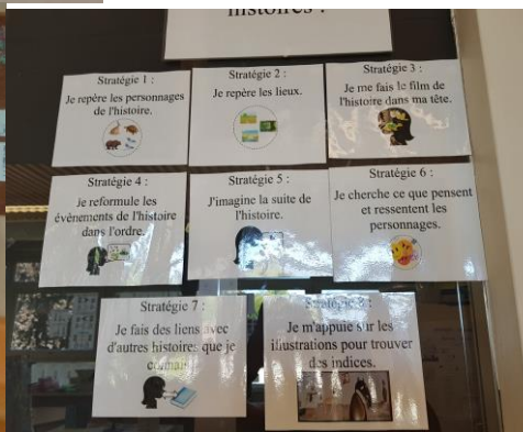
Travail en ateliers et en autonomie